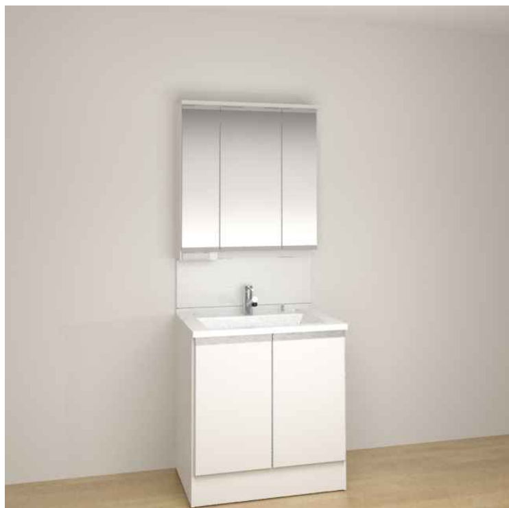
※画像はイメージです。組合せなどはお見積書をご確認ください。