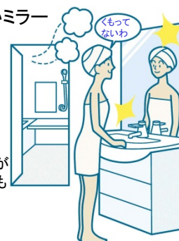
※3面鏡はセンターミラーのみ、2面鏡はメインミラーのみ。

電気代ゼロで、全面クリア。新感覚のミラーです。鏡の表面に、吸水性・親水性のある膜をコーティング。狭い部分しか効果のなかった従来品(ヒーター)に対し、全面がくもりにくいので、お風呂上がりも鏡はいつもクリア。電気代もかからないので経済的です。