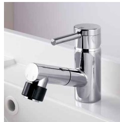
マルチシングルレバーシャワー レバー1つで調節。