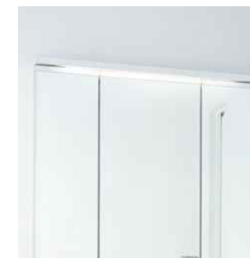
薄型のLED照明で空間すっきり。省エネ・長寿命を実現しています。点灯幅は685mm。