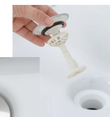
掃除しにくいフチの隙間がない排水口。ゴミを取り除きやすいヘアキャッチャー。