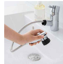
吐水口部分を引き出せばボール掃除もラクラクです。