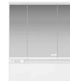
3面鏡 LED照明 ミドルパネル